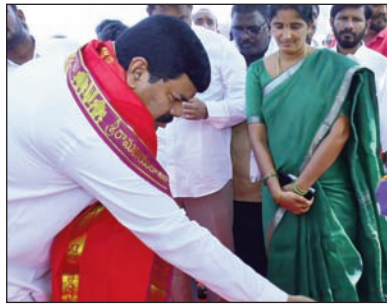
నరసింహారావు, ప్రజా ప్రతినిధులు, పలు పార్టీల నాయకులు, రైతులు, స్థానికులు పాల్గొన్నారు.